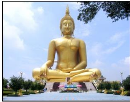
شكل ٣، تمثال بوذا العظيم في تايلاند، طوله ٩٢م وعرضه ٦٣ م، ١٩٩٠ - https://www.newworldencyclopedia.org/entry/Thai_art (19 March 2024) ٢٠٠٨