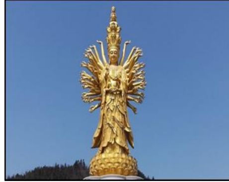
شكل ٥، نصب تنكاري "جيشان جوانيين"، ارتفاعه ٩٩ متراً، برونز مذهب، على قاعدة تشبه زهرة اللوتس، عام ٢٠٠٩ https://en.wikipedia.org/wiki/Guishan_Guanyin (13 Feb 2024)