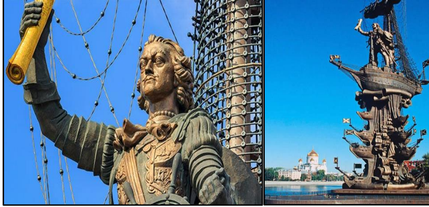
شكل رقم ٤، تمثال "بطرس الأكبر"، إرتفاعه ٩٨م، من الفولاذ والبرونز والنحاس، عام ١٩٩٧ https://www.introducingmoscow.com/peter-the-great-statue (10 Feb 2024)

يعتبر التمثال وجهة سياحية مهمة في موسكو، حيث يجذب السياح من مختلف أنحاء العالم والإستمتاع بروعته الفنية. إن التماثيل التاريخية والثقافية غالباً ماتشكل معلماً جذاباً حيث يتوجه الزوار إلى هذه المعالم لفهم الثقافة المحلية وإستكشاف التاريخ وفهم تأثير الشخصية على تاريخ روسيا. كذلك يسهم وجود التمثال في نقل رسالة تاريخية وثقافية للمجتمع المحلي والزوار. يعمل على الوعي بالتراث الثقافي ويشجع الحفاظ على هذا التاريخ للأجيال القادمة. بهذه الطرق، يلعب التمثال دوراً فعالاً في تعزيز الهوية الثقافية وجذب السياح مما يسهم في الأقتصاد المحلي وتعزيز الوعي الثقافي.