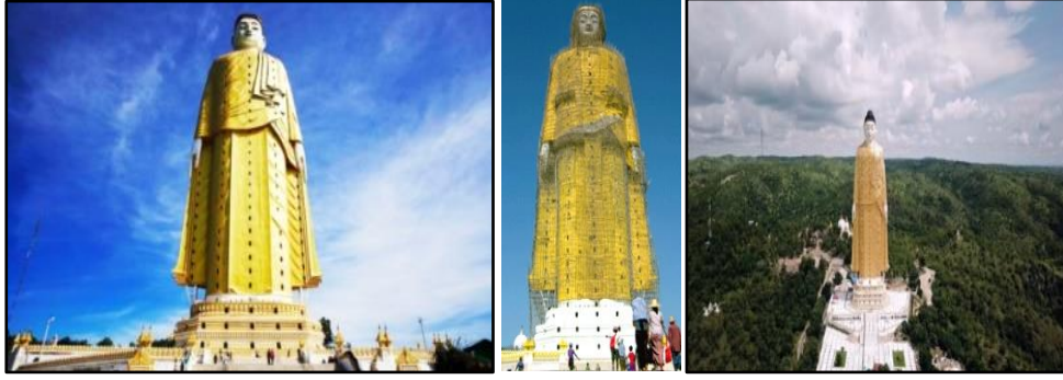
شكل رقم ٨، تمثال لايبون سيكيا ، ارتفاع ١٣,٥ متر، عام ١٩٩٦ - ٢٠٠٨. البناء مطلي باللون الأصفر الذهبي ( 23May 2024 ) https://web.archive.org/web/20200512212459

بميلها لمنطق هندسي كما يعتمد على تحقيق التجانس والتوافق والوحدة في التشكيل والوصول للتجريد والتبسيط النسبي في الكتلة الرأسية المستقرة ذات إمتداد أفقي يقف مستقيماً ويوجد تجاوزيف أو فتحات (كالشبابيك) ربما يكون هناك توجيه فني في طريقة صياغة التمثال وتحديد تفاصيله ، ليعبر عن التفرد الفني والمهارة الحرفية كذلك يتسم بطول مساحية خطية يعبر عن الوفاق والسكينة مما يجعله مكاناً مقدساً ومكان للبحث الروحي. يعد التمثال من معالم الجذب الرئيسية في المنطقة، حيث يجذب السياح والمسافرين الراغبين في إستكشاف التراث الديني والثقافي لميانمار. وكذلك التفاعل مع البيئة المحيطة والمشاركة في الفاعليات الدينية التي قد تقام في الموقع المتميز: يقع التمثال في مجمع Maha Bodhi Ta Htaung، وهو محاط بمئات التماثيل البوذية الأخرى وأشجار البوذي يطل على "نهر تشيندوين"، مما يوفر فرصاً للإستمتاع بالمنظر الطبيعية الخلابة والتصوير الفوتغرافي. ويوفر المكان أيضاً فرصاً للزوار للتأمل والأسترخاء وهو يميزه جذابه للباحثين عن الخلود لهدوء الذي أعطى تكامل للرؤية النحتية وكأن العمل جزء من البيئة المحيطة به يتأثر بالضوء الواقع عليه مما أعطى شعور بوحدة التصميم.