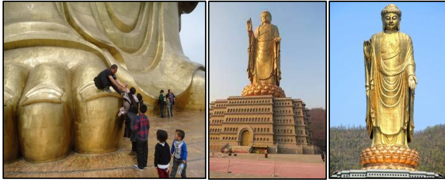
شكل رقم 9، تمثال معبد الربيع لبوذا ، ارتفاع ١٥٣,٧٩١ متر، عام ١٩٩٧ - ٢٠٠٨

https://astrologicalworldmap.com/2013/04/25/the-spring-temple-buddha. (28Feb2024)