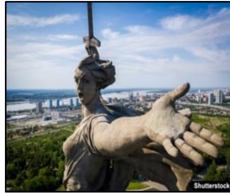
شكل ١، تمثال الوطن الأم ينادى ، الأرتفاع ٨٥ م، برونز ، خرسانه. عام ١٩٥٩-١٩٦٧ https://www.atlasobscura.com/places/the-motherland-calls (23 January 2024)