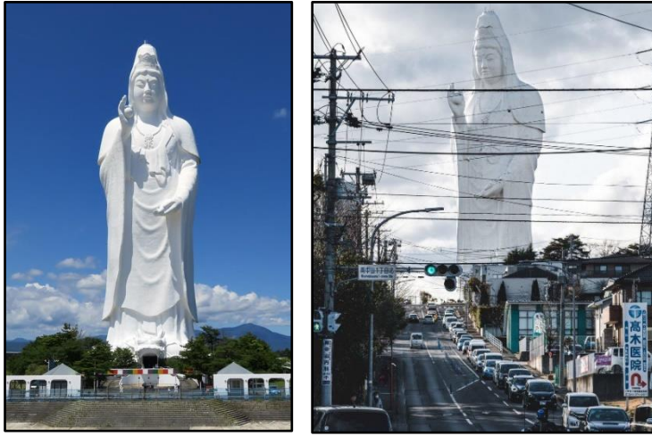
شكل ٦، تمثال سنداي دايكانون "حامله الجوهرة" "Sendai Daikannon-2018" عام ٢٠١٨، طوله ١٠٠ متر https://themindcircle.com/sendai-daikannon/ (22May 2024).

الألياف الزجاجية: الطبقة الخارجية للتمثال مصنوعة من الألياف الزجاجية ، والتي تضيف إلى مقاومته للتآكل وتمنحه مظهرًا ناصع البياض، يحاكي الصور التقليدية للآلهة البوذية في اليابان. النظام الهيكلي لمقاومة الزلازل: نظرًا لأن اليابان تقع في منطقة نشطة زلزاليًا، فقد تم تصميم التمثال بطرق هيكلية متقدمة لمقاومة الزلازل، بما في ذلك استخدام تقنيات التخميد الزلزالي لإمتصاص وتقليل تأثير الهزات الأرضية ( البنية التحتية). القاعدة الأساسية للتمثال تضم أنظمة دعم متقدمة، بما في ذلك دعائم خرسانية وفولاذية تعمق في الأرض لضمان الإستقرار على المدى الطويل، حتى في ظل الظروف البيئية القاسية.