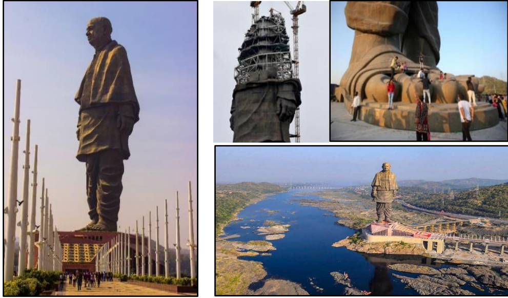
شكل رقم ١٠، تمثال الوحدة Statue of Unity ، (١٨٧٥-١٩٥٠)، الهند، طوله ١٨٢ متر. https://www.hindustantimes.com/india-news/behind-the-making-of-statue-of-unity/story-k67YKhhZaXb68ph5Zos54M.html (7 Mar 2024)