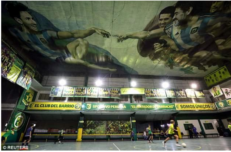
شكل ٦- الفنان "سانتياجو باربيتو" Santiago Barbeito - جدارية "خلق كرة القدم" - "باراكاس" ب" بوينوس آيريس" جنوبي الأرجنتين Argentina - ٢٠٢١ م.