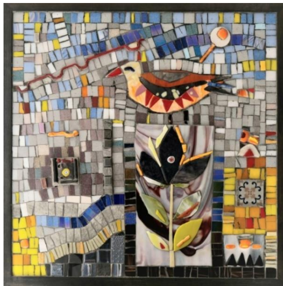
شكل ١٧ - من أعمال الباحثة- زجاج مصهور وفسيفساء زجاجية وأحجار مُصنعة - على خشب- مقاس ٥٣ سم x ٥٣ سم - ٢٠٢٢ م.

يصور هذا العمل شكل (١٦) أحد المربعات الموجودة في التصميم، حيث اختارت الباحثة المربع الذي يصور راكبة الدراجة، وهي تسابق الريح، بينما أحاطت بها على الجانبين مجموعة من الورود المبهجة للون. وفي الجزء السفلي تم كتابة كلمة "بطل" بالانجليزية Champ وذلك فوق مساحة من الزجاج المصهور التي تصور كرة السلة. وفي الجانب الأيسر والأيمن السفليين، تم وضع بعض الرموز والورود على خلفية صفراء لتعطي إحساس بالسعادة. بينما جاءت بعض المساحات في العمل مجردة تماماً.