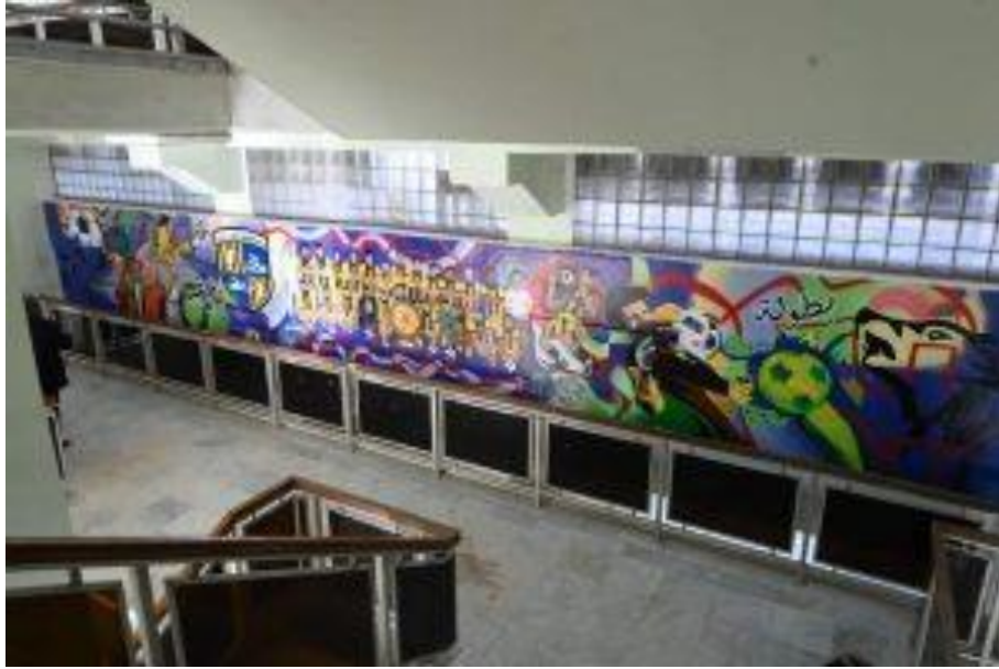
شكل ٢ - صورة مُجمعة لجدارية بنادي المقاولون العرب- مصر- ٢٠٢٣ م.