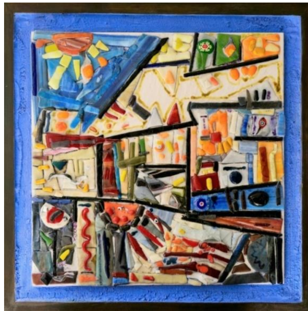
شكل ١٣ - من أعمال الباحثة- زجاج مصهور على بلاطة خزفية- مع عجانن أسمنتية على خشب- مقاس ٥٣ سم x٥٣ سم - ٢٠٢٢ م.

في العمل السابق شكل (١٢) قامت الباحثة باختيار شكل الشجرة الوارفة التي تندلع منها الأغصان والألوان، وقد جاءت بشكل تجريدي في صورة مساحات زجاجية عريضة اعتلتها قطع الزجاج المصهور. مع مساحات خطية تتقاطع عرضاً وطولاً، بنهايات حرة وثابتة. وقد جاءت المساحة المحيطة الفارغة، لتحتضن الشكل الأصلي بلون أصفر وهاج مُنفذ بالعجانن الأسمنتية. بينما لامس إطار من الفسيفساء الزجاجية البرواز الخشبي من الداخل.