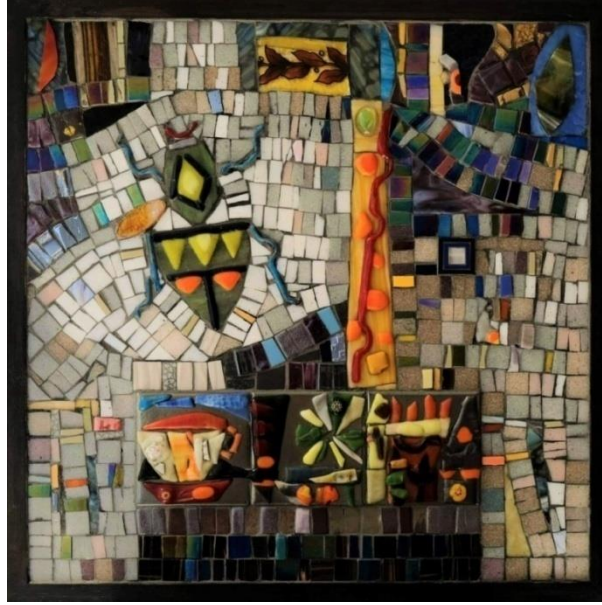
شكل ١٨ - من أعمال الباحثة- زجاج مصهور على بلاطات خزفية- وفسيفساء زجاجية وأحجار مُصنعة -على خشب- مقاس ٥٣ سم x ٥٣ سم - ٢٠٢٢ م.

في هذا العمل (شكل ١٧) يمكن رؤية إحدى الورود والطيور وبعض العناصر الزخرفية. وقد احتلت النبتة والطائر من فوقها مساحة المنتصف تقريباً، وجاءت الوردة من الزجاج المصهور، والطائر أيضاً، بينما امتلأت المساحة من حول أبطال العمل بمجموعة من البلاطات الزخرفية والفسيفساء الزجاجية الملونة. وتراوحت الألوان بين الأزرق والأصفر والرمادي.