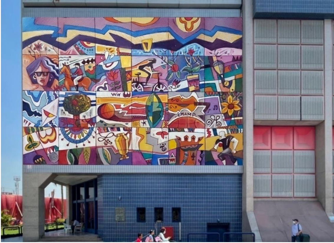
شكل ١٠ - صورة توضح شكل التصميم عند وضعه على المبنى ببرنامج الفوتوشوب Photoshop.