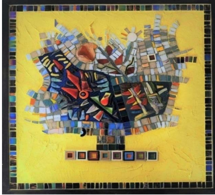
شكل ١٢ - من أعمال الباحثة- زجاج وفسيفساء زجاجية وزهور الميليفيوري Millifiori مع وحدات بلاستيكية- على خشب مع عجانن أسمنتية-٦٣ سم x٦٣ سم في ٢٣ سم- ٢٠٢٢ م.

في العمل السابق شكل (١٢) قامت الباحثة باختيار شكل الشجرة الوارفة التي تندلع منها الأغصان والألوان، وقد جاءت بشكل تجريدي في صورة مساحات زجاجية عريضة اعتلتها قطع الزجاج المصهور. مع مساحات خطية تتقاطع عرضاً وطولاً، بنهايات حرة وثابتة. وقد جاءت المساحة المحيطة الفارغة، لتحتضن الشكل الأصلي بلون أصفر وهاج مُنفذ بالعجانن الأسمنتية. بينما لامس إطار من الفسيفساء الزجاجية البرواز الخشبي من الداخل.