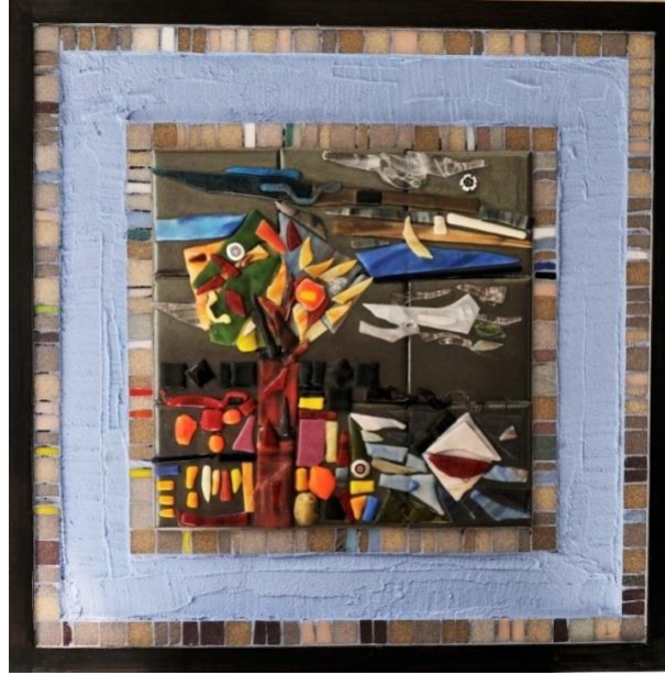
شکل ١٤ - من أعمال الباحثة- زجاج مصهور على بلاطات خزفية مُجمعة- مع فسيفساء زجاجية- وعجانن أسمنتية على خشب- مقاس - مقاس ٥٣ سم x ٥٣ سم - ٢٠٢٢ م.

أما العمل شكل (١٣) فقد جاء مُنفذاً على بلاطة خزفية كبيرة مقاس ٥٠ سم x ٥٠ سم، وقد تم لصقها على القاعدة الخشبية وملء المساحة الفراغية المُتبقية بالعجينة الأسمنتية. وقد تم صهر القطع الزجاجية على سطح البلاطة في تشكيلات مُتعددة تُطابق أحد الرسوم التحضيرية التي نفذها الباحث.