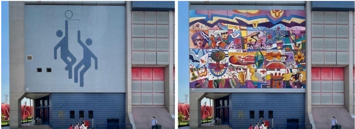
شكل ١١ - صورة للمبنى قبل وبعد وضع التصميم افتراضياً على الجدار.