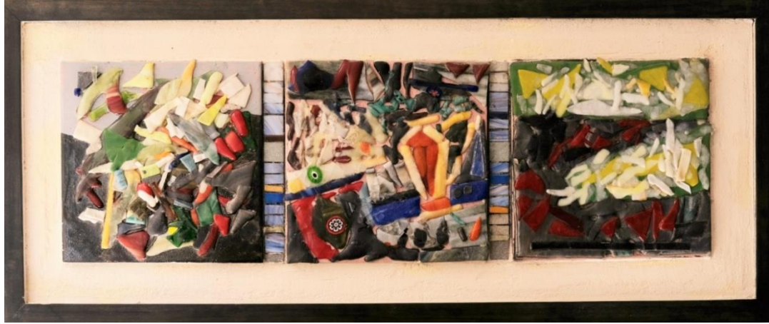
شكل ٢٠ - من أعمال الباحثة- زجاج مصهور على بلاطات خزفية- وفسيفساء زجاجية- ٣٣ سم x ٧٨ سم - ٢٠٢٢ م.

يُصور العمل المُستطيل شكل (١٩) مجموعة مُقسمة من البلاطات الخزفية المتفاوتة الأحجام، حيث تم وضع مُربعان على طرفي العمل، وتم وضع اثنان من المربعات الصغيرة في المنتصف، ثم وضع بعض قطع الفسيفساء فيما بينهما. وقد تم صهر قطع صغيرة من الزجاج على سطح تلك البلاطات الخزفية. وقد جاءت البلاطات مُصورة مجموعة من الألوان في شكل تجريدي. بينما جاء الوجه القابع على اليسار لإمرأة موجودة في التصميم الأصلي. وجاءت الفسيفساء في المنتصف لتتماشي وتربط بين تلك البلاطات من حيث اللون والاتجاهات. وقد أحيطت البلاطات بعجينة أسمنتية رمادية اللون.