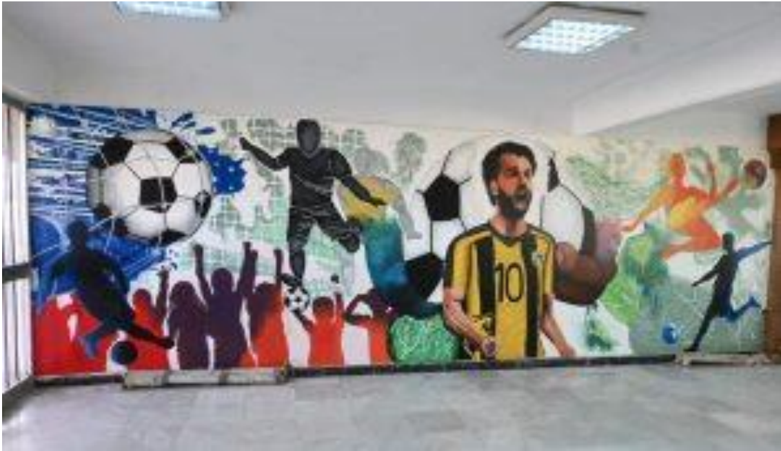
شكل ١ - جدارية بنادي المقاولون العرب- مصر- ٢٠٢٣ م.