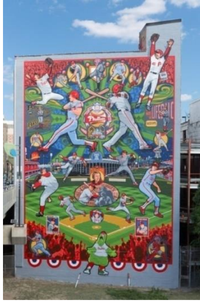
شكل ٤- ديفيد ميكشايين David McShane - جدارية عن فريق فيلادلفيا للبيسبول Philadelphia Phillies الأمريكية للمُحترفين - ش ٢٤ وول نت Located at 24th and Walnut streets - الولايات المتحدة الأمريكية .