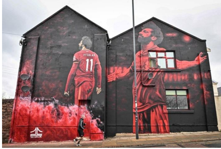
شكل ٣- جون كولشواو John Culshaw - جدارية للاعب المصري محمد صلاح - طريق أنفيلد Anfield Road - إنجلترا - ٢٠٢٢ م .