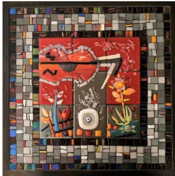
شکل ١٥ - من أعمال الباحثة- زجاج مصهور على بلاطات خزفية مُجمعة- مع فسيفساء زجاجية- على خشب- مقاس ٥٣ سم x ٥٣ سم - ٢٠٢٢ م.

أما شكل (١٤) فجاء عبارة عن مجموعة من قطع الزجاج المصهور الموضوع على مجموعة من البلاطات الخزفية المُجمعة، والتي تصور جُزءاً من التصميم المُلون وعمل دمج بين إثنين من مُربعاته، وقد صور العمل شجرة وقارب صغير للتجديف. وأحيط الشكل بمساحة أسمنتية من اللون السماوي قبل أن تتلاقى مع إطار من الفسيفساء يلاصق الإطار الخشبي.