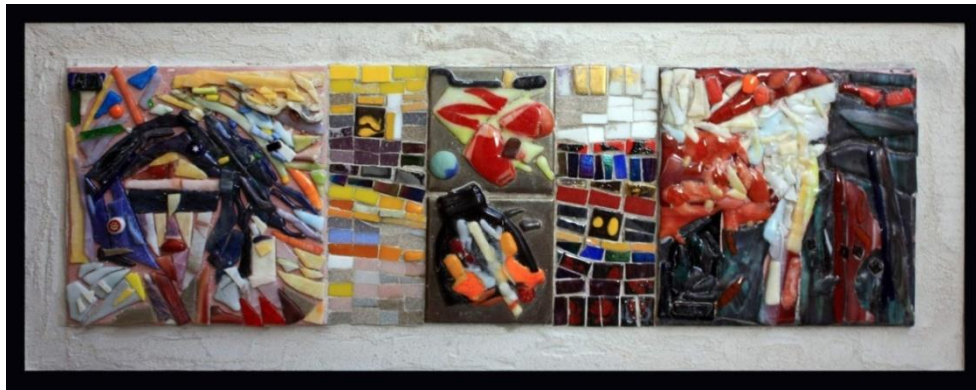
شكل ١٩ - من أعمال الباحثة- زجاج مصهور على بلاطات خزفية- مع فسيفساء زجاجية- ٣٣ سم x ٧٨ سم - ٢٠٢٢ م.

في العمل السابق شكل (١٨) اختارت الباحثة أن تستلهم أيضاً من الأجواء العامة للمكان، حيث اختارت أن يكون بطل العمل إحدى حشرات الحديقة ذات الألوان المتعددة، لتحتل المساحة اليمنى من العمل. كما جاورتها وقبعت فوقها مجموعة من الزخارف النباتية المرسومة بأكاسيد الحريق. بينما جاءت المساحة السفلية من العمل لتحتلها ثلاث بلاطات خزفية، قام الباحث بصهر قطع الزجاج عليها، وقد صورت فنجاناً من القهوة وبعض الزهور ومساحة مجردة موجودة في التصميم الرئيسي. وأحيطت تلك العناصر والوحدات بالفسيفساء الزجاجية الملونة. وجاء العمل مُستعيناً بعناصر موجودة في التصميم وأخرى من الخيال ولكنها مستمدة من العناصر والأنشطة التي تحدث في النوادي الاجتماعية والرياضية.